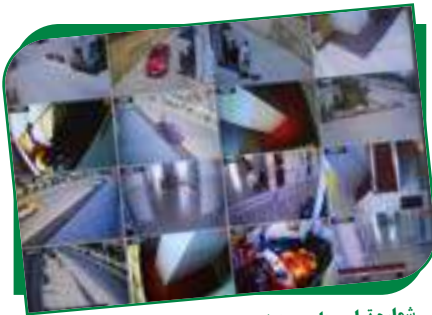
شماره تماس های مسئولین صحتی و امنیتی

از آنجا که مسئولیت امنیتی از جمله امکانات و سهولت های یک نهاد تحصیلی میباشد تا زمینه آموزش و تحصیل با خاطر راحت و آسوده را برای کارمندان، اساتید و محصلین آماده سازد، این دانشگاه دارای دوربین های امنیتی در تمام قسمت های مختلف دانشگاه چه در محیط بیرونی و چه در محیط داخلی میباشد بصورت شبانه روزی روشن بوده و تمام واقعات را ثبت مینماید. قابل ذکر است که پوهنتون جامی بخاطر حفظ امنیت هر چه بیشتر کارمندان، اساتید و محصلین خویش دارای گاردهای امنیتی نیز میباشد.